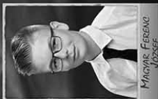
MAGYAR FERENC JÓZSEF