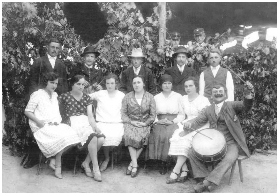
Elődeink 1910-es évek

A május 26-i szabadtéri előadásunkra szeretettel várunk mindenkit, melyet a faluház udvarán tervezünk bemutatni.