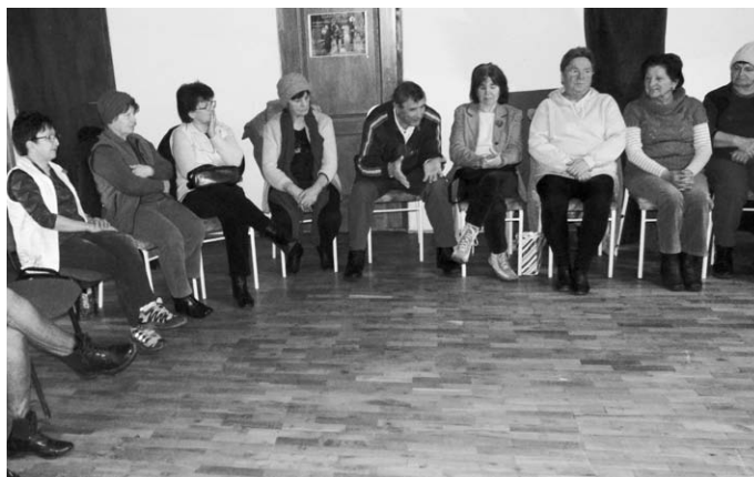
„Éppen péntek” Egészségklub