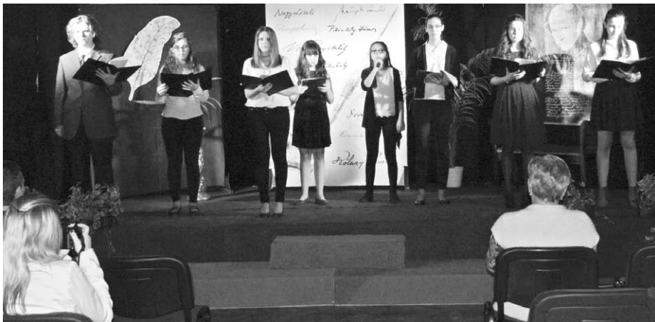
A Magyar Kultúra Napja

Január 27-én a Faluházban került megtartásra a Magyar Kultúra Napjának közösségi rendezvénye. Sajnos a meghívott előadó betegsége miatt lemondta szereplését, de a Baracscai Dráma Klub tagjai is készültek erre a napra, így a kis létszámban megjelent érdeklődők nem maradtak műsor nélkül.