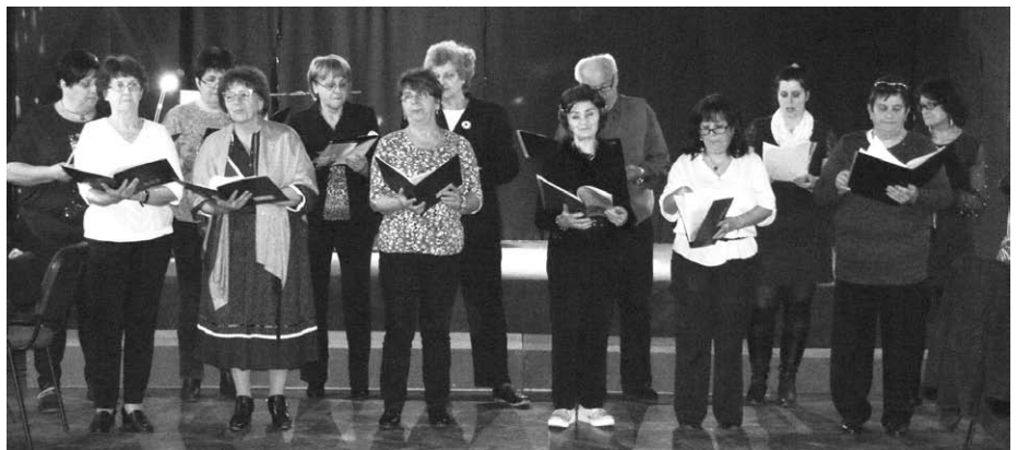
A Baracscai Dalkör énekel a tavaszváró rendezvényen

olvasni vágyók előtt nyitva állt a községi könyvtár, a következő előadásokra folytak a Dráma Klubosok próbái. A Faluházban jóga, alakformáló torna, zumbafitness táncóra közül választhatott az, aki vala-