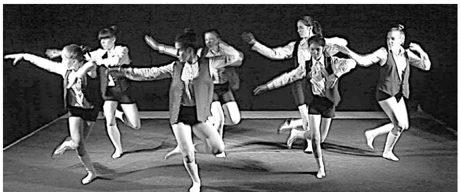
Légy jó mindhalálig próba