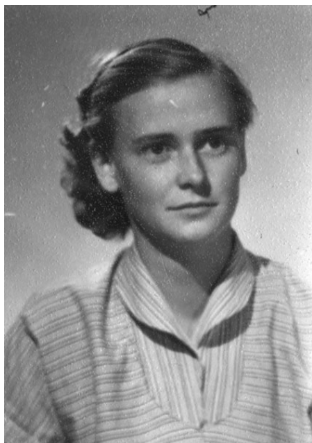
Különleges előadással készülünk az '56-os Önkormányzati rendezvényre Baracsán.