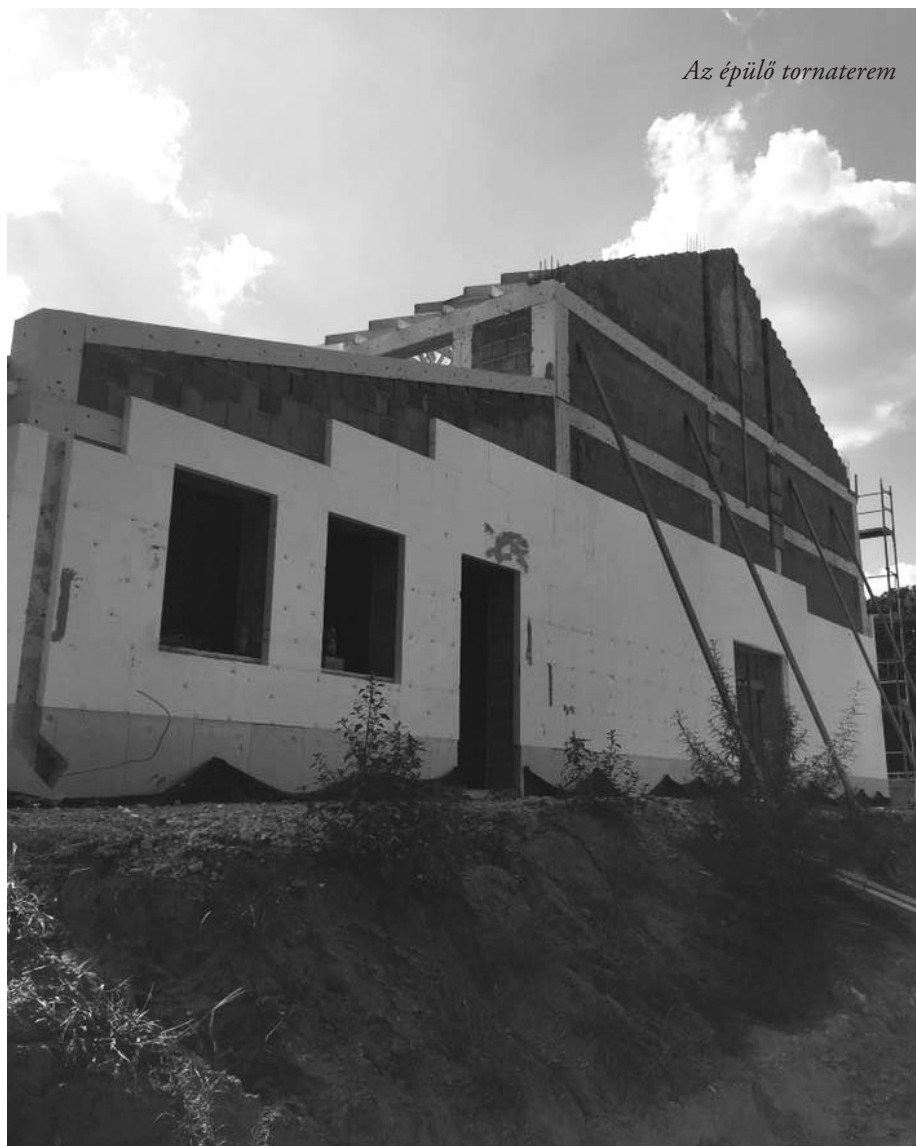
Az épülő tornaterem

Emellett kérem Önöket, hogy tartsák tiszteletben a tanítási időt. Az intézmény egyben munkahely is. Tanulóink védelme, valamint vagyonvédelmi okok miatt kérjük, hogy gyermekeiket a parkolóig kísérjék, illetve várják meg.