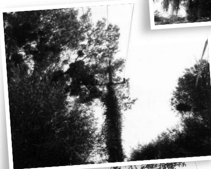
A diófa ágai kiefeszültségű szigetetlen hálózatban, életveszélyes (szélben a faágak összeverik a fázisvezetőket, ezzel időleges áramszünetet okozva)