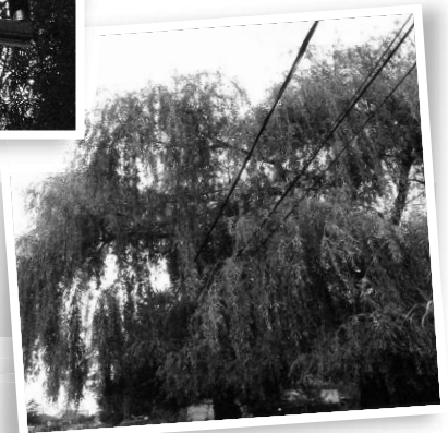
Veszélyes a vezetékek fölé hajló faág (valaki felmászik rá és ráhajlik a vezetékre), ill. az oszlopokra tekeredő kúszónövény