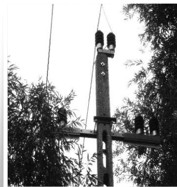
Fűzfaágak 20 kV biztonsági övezetében (gyakorlatilag hozzáér a fázisvezetőhöz)