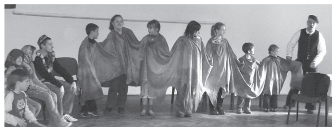
Bambi buli és a „hétfejű sárkány” legyőzése