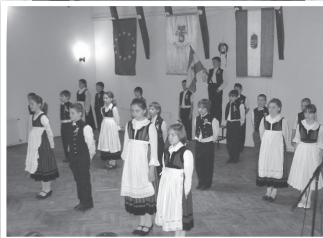
Farsangi jelmezbemutató az iskolai rendezvényen