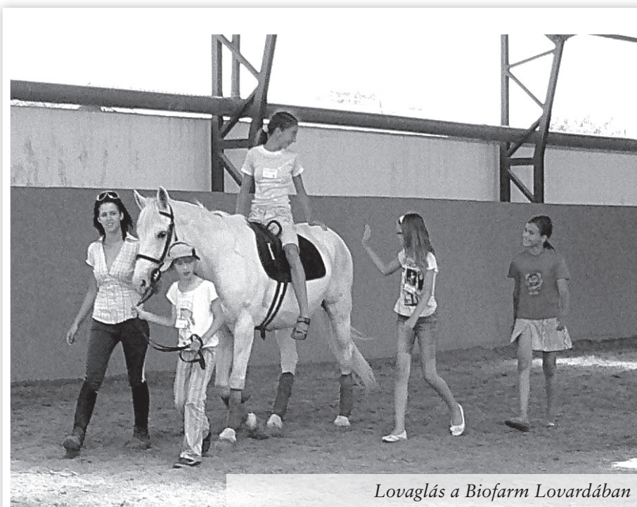
Lovaglás a Biofarm Lovardában