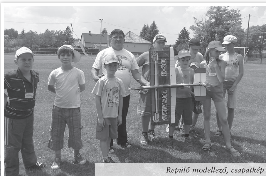
Repülő modellező, csapatkép

Már csak egy ajtót szeretnénk a faluház hátsó sarka és az első kerítésoszlop közé. Az alapanyag megvan, el kell