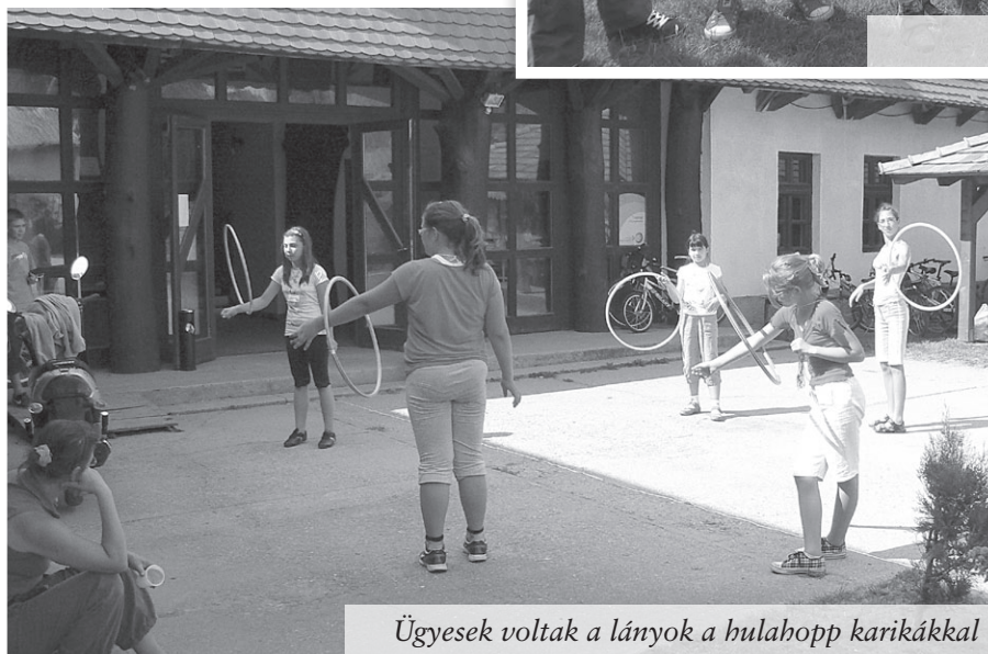
Ügyesek voltak a lányok a hulahopp karikákkal

készíteni, egy kis vasas és asztalos munka van hátra. Ha valakinek segíteni van kedve, szívesen vesszük szakemberek jelentkezését!