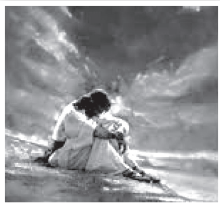
Krisztus böjtölése a pusztában

ak miatt mégis erre kényszerülök. Úgy vélem, az ügy nagy vonalakban mára mindenki előtt ismert. Konkrétan,