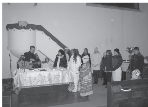
A mesélő és az angyali kar