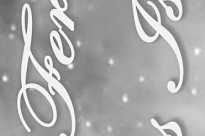
Nagyárpád Ágnes Ágnes