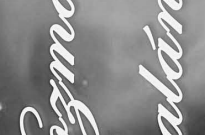
Nagyárpád Ágnes Ágnes