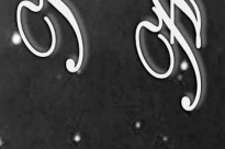
Nagyárpád Ágnes Ágnes