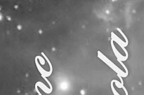
Nagyárpád Ágnes Ágnes